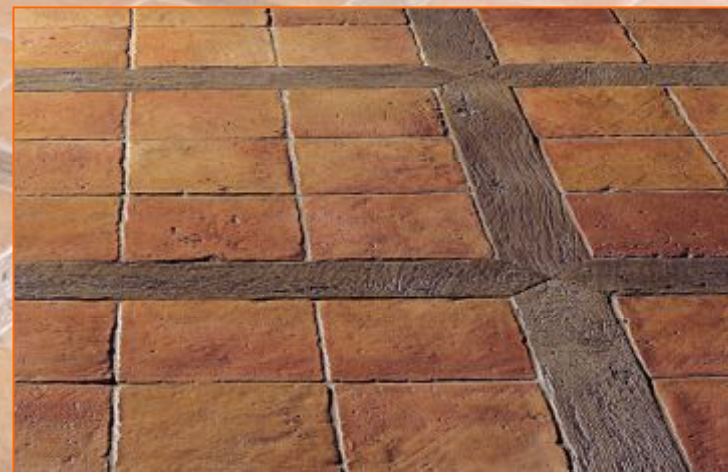
Плитка под старину 30x30; 70x10 1,5см Цвет красный опаленный