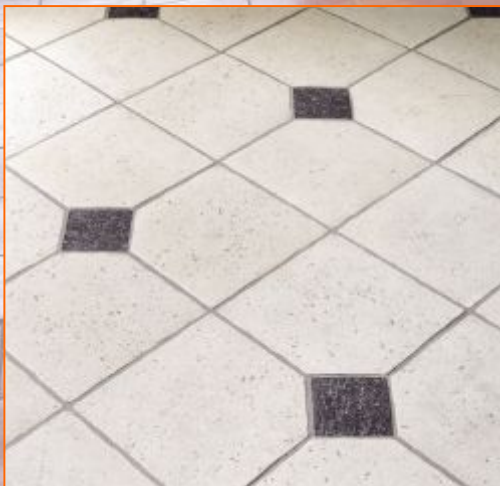
Monastere Плитка под старину 30x30; 1,5см