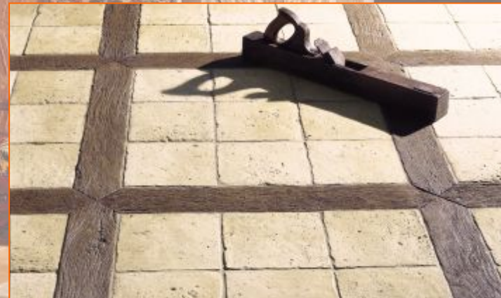
30x30 см; 70x10; 1,5см Цвет камня 20x20 см; 70x10; 1,5см Цвет камня