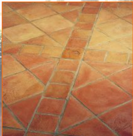
Bastide Плитка под старину 22 x 22 см; 1,5см

Pastoral 12x12см Цвет красный опаленный, розовый прованский и цвет камня.