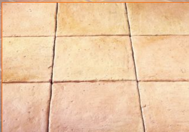
Плитка под старину 30x30; 1,5см Цвет розовый прованский