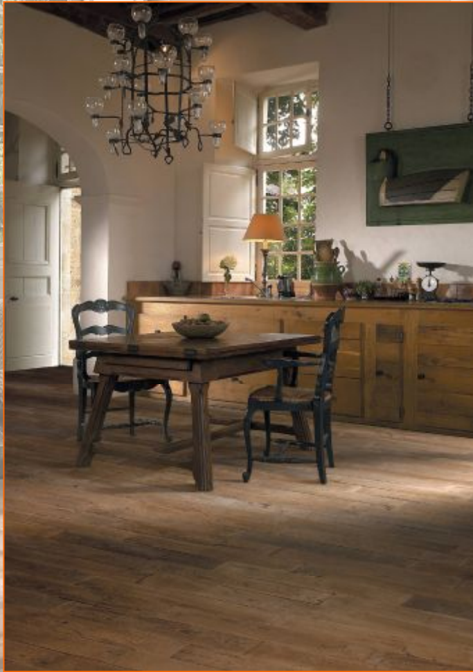
Sarladais Репродукция паркетного настила, пластины 69,5x13,5; 1,5см