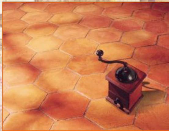
Tomettes Плитка под старину 22 x 22 см; 1,5см

Pastoral 12x12см Цвет красный опаленный, розовый прованский и цвет камня.