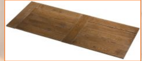
Последовательная кладка с перегородками