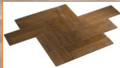
Кладка клиньями с двойной пластиной