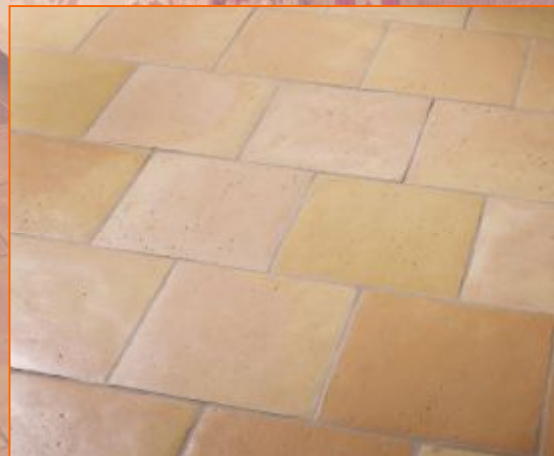
Reale Плитка под старину 30x30; 1,5см

Цвет красный опаленный, розовый прованский и цвет камня.