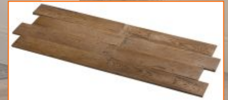
Смещённая кладка шахматкой