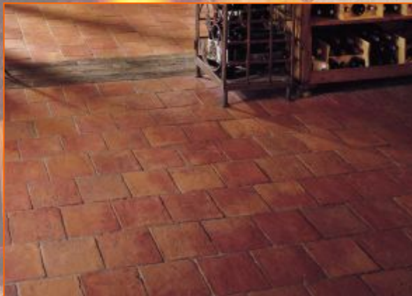
30x30; 1,5см Цвет красный опаленный